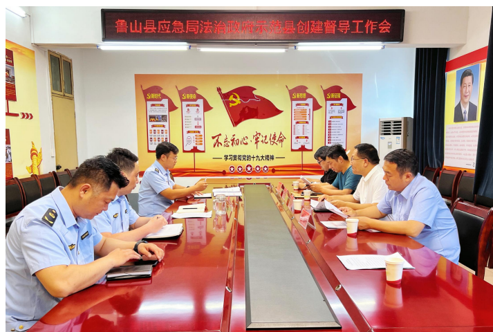
(督导组在县应急管理局督导创建工作)