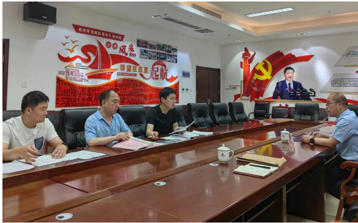
(督导组在先进制造业开发区管委会督导创建工作)