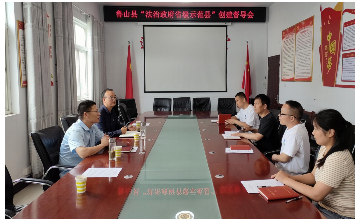
(督导组在县自然资源局督导创建工作)