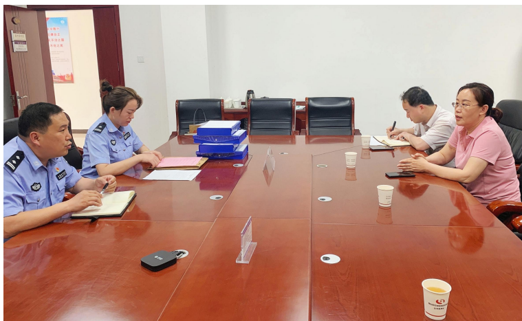
(督导组在县公安局督导创建工作)