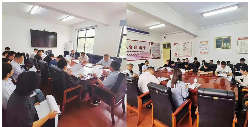
(县政府办召开法治政府建设示范创建工作分解会、工作推进会)