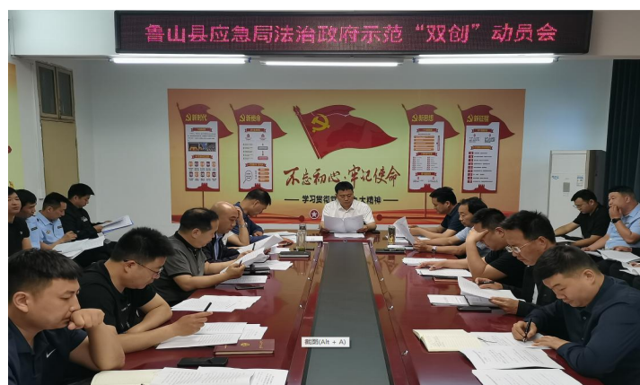
(县应急管理局召开法治政府建设示范创建工作动员部署会)