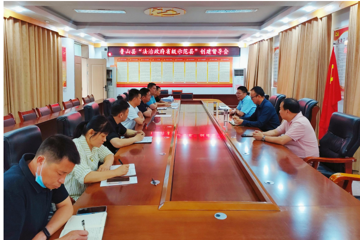
(督导组在县交通运输局督导创建工作)