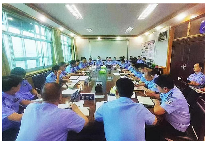
(县公安局召开法治政府建设示范创建工作动员部署会)